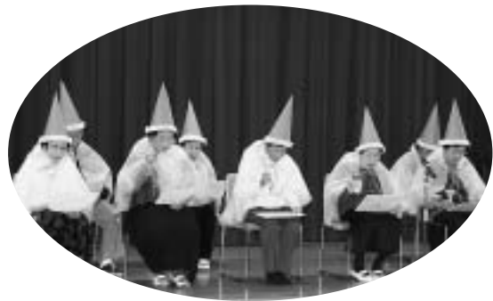
▲“生きがい支援事業”利用者によるハンドベルの演奏（社協ふれあいクリスマス会）