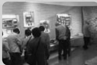
11月7日(金) 山田地区 福祉委員会管外研修