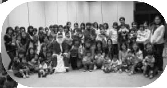
▲子育てサークルペアペアクラブクリスマス会（役場万葉ホール）