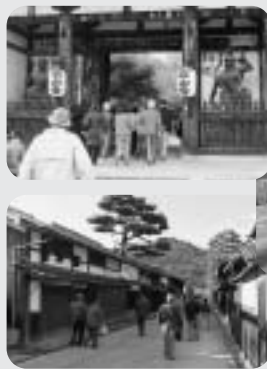
10月28日(火) 春日地区福祉委員会管外研修