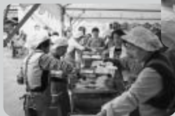
9月27日(土) 太子地区ふれあい広場