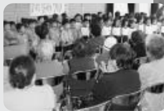
12月10日(水) 山田地区 ふれあいクリスマス会