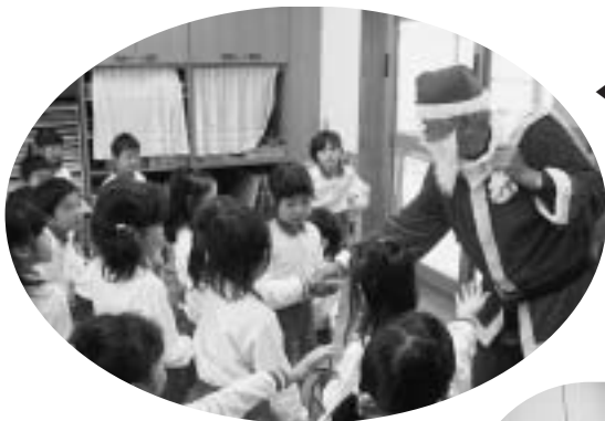
◀お菓子のプレゼントを持ったサンタクロースが町内の幼稚園・保育園を訪問しました