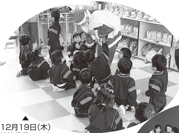
12月19日(木) 社協役員による 町内幼稚園・ 保育園訪問