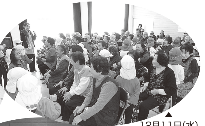
12月11日(水) 山田地区福祉委 員会“ふれあい クリスマス会”