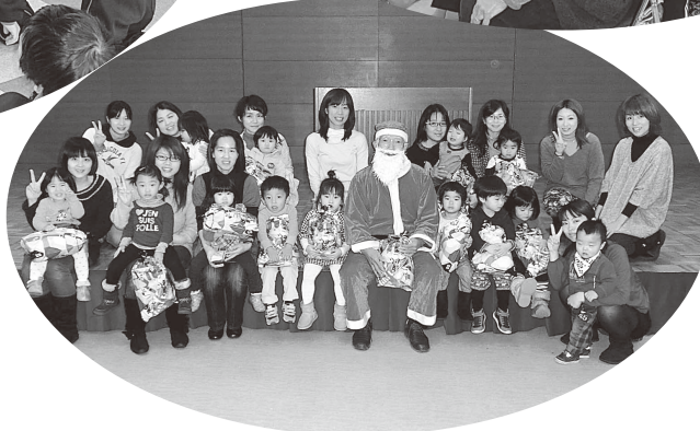
12月19日(木) 子育てサークル ペアペアクラブ “クリスマス会”