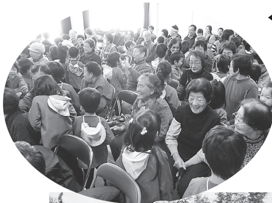
12月10日 山田地区福祉委員会 ふれあいクリスマス会