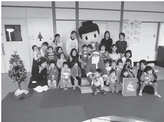
12月19日 子育てサークルペアペア クラブクリスマス会