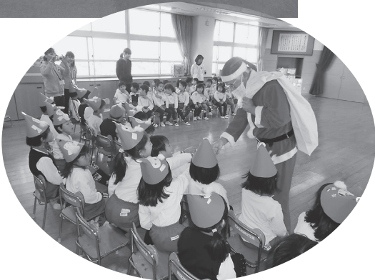
12月19日 町内幼稚園・保育園への 歳末訪問