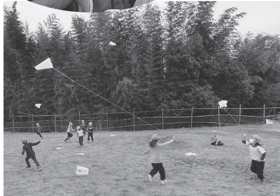
1月13日 松の木保育園児が 福祉センター裏の広場で たこ揚げ