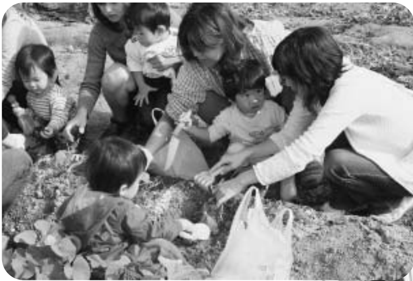
▲ ペアペアクラブ いも掘り