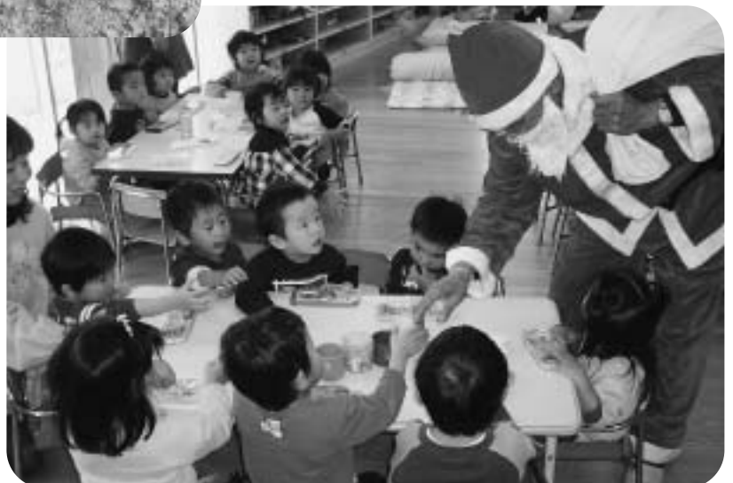
▲ サンタさんからのプレゼントに大喜びの子どもたち