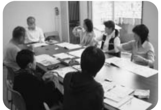
▲ 手話講座での1コマ